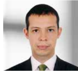
Can Örüng Mitglied T.C. Ziraat Bankası A.Ş., Ankara/Turkey